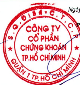
Lâm Hữu Hồ